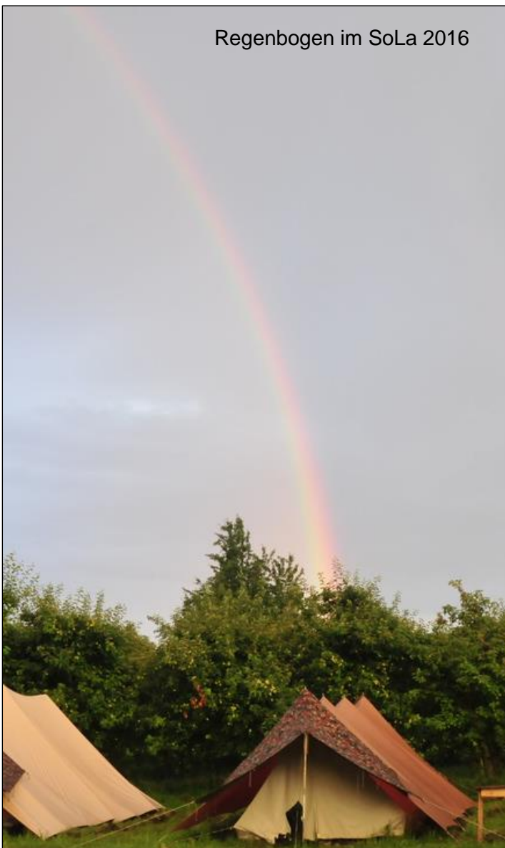
Regenbogen im SoLa 2016

Die Pfadi ist in verschiedene Stufen eingeteilt. Die Biberstufe richtet sich an Kinder im Kindergarten. Sie sollen jeweils einmal im Monat ihren Bewegungsdrang ausleben dürfen und in Kontakt mit der Natur und der Umwelt treten.