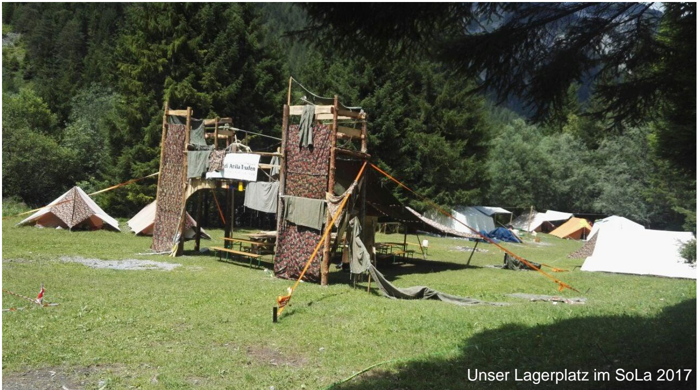
Unser Lagerplatz im SoLa 2017

Die Anmeldung für beide Lager findet jeweils im Frühling online statt. Dazu schalten wir ein Anmeldeformular auf unserer Homepage auf. Die Detailinfos mit Treffpunkt, Packliste und allen sonstigen nötigen Informationen erhalten ihr jeweils spätestens 3 Wochen vor dem Lager per Email.